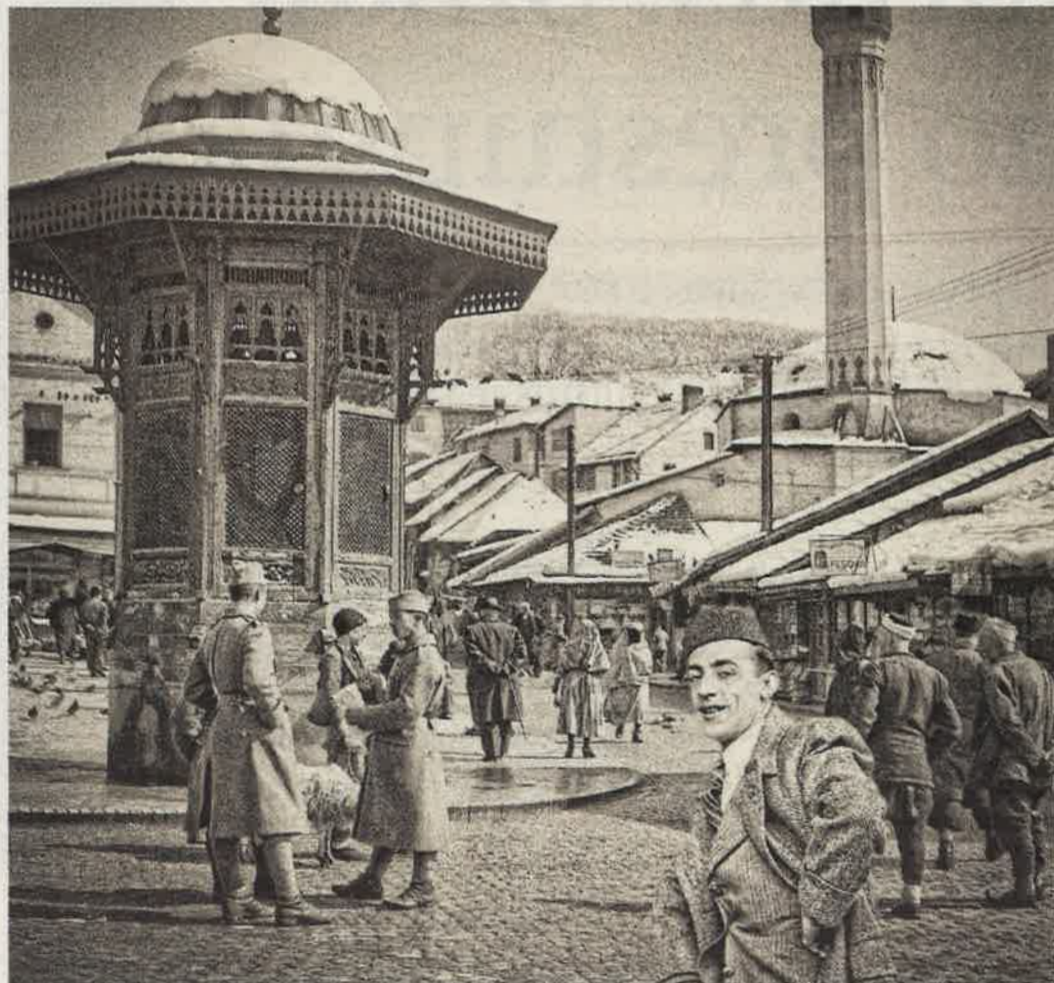
Fotograf Halačević na Baščaršiji

Prizori sa ulica, trgova, pijaca, iz kafana i kućnih dvorišta dokumentiraju „aktivnu miroljubivu koegzistenciju”