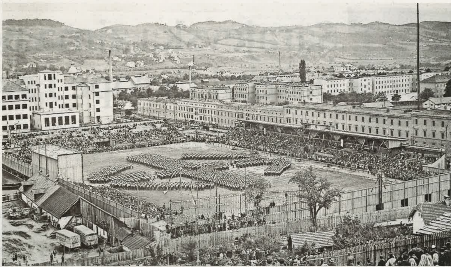
Sokolski slet u Sarajevu

objekte ili pokraj samih gradilišta. Na tek podignutim velikim stadionima održavane su sportske i omladinske manifestacije, utakmice i parade u slavu nacionalnog prepорода. Ipak, i nadalje u starim čaršijama, koje su bile glavne žile kucavice osmanskih gradova, ne možemo se oduprijeti dojmju kako su ljudi iz svih slojeva pazarivali i kahvenisali, onako kako su to odvajkada činili. Za njih kao da je vrijeme zaustavljeno i kao da se ništa u međuvremenu nije desilo.