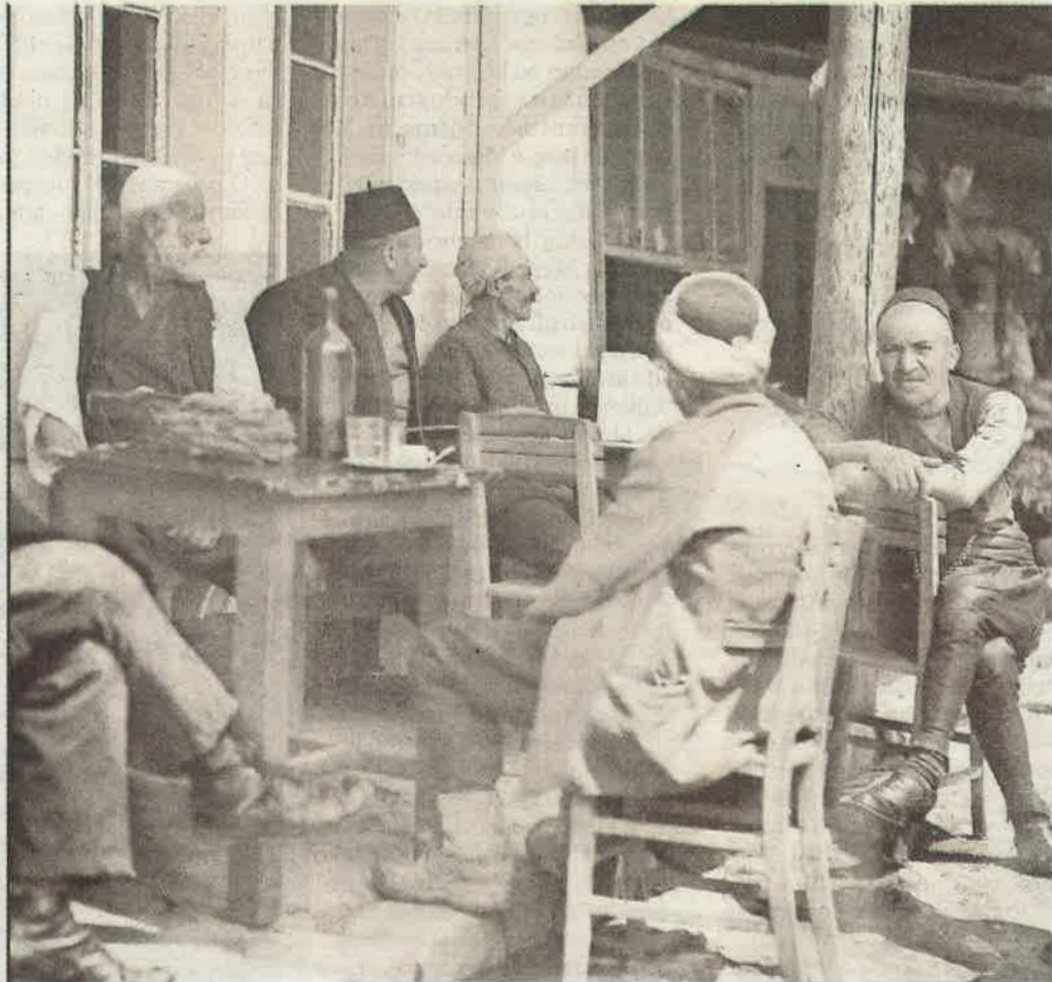
Kahva