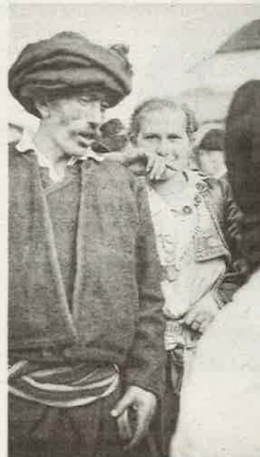
Čovjek u katoličkoj nošnji na Baščaršiji / ALIJA M. AKŠAMIJA

Ova putujuća izložba, koja je premijeru imala u Švicarskoj i koja je s velikim interesovanjem publike i medija prikazana u Srbiji, nastala je kao rezultat međunarodne saradnje u okviru naučnoistraživačkog projekta SIBA (Vizuelni pristup istraživanju svakodnevice u turskim i jugoslavenskim gradovima 1920-ih i 1930-ih) pod vodstvom Nataše Mišković, profesorice na Bliskoistočnim studijama Univerziteta u Baselu. Projekt je finansiran sredstvi-