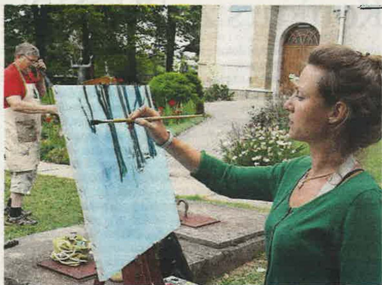
Sa kolonije Breške

Oni su svoje slike priložili fundusu HKD-a Napredak Tuzla, u kojem se već nalazi više od 750 djela nastalih od osnivanja Likovne kolonije Breške do danas, a od njihove prodaje finansiraju se pojedine aktivnosti društva, te stipendiraju nadareni učenici i studenti iz BiH. Izložba slika sa XVIII likovne kolonije Breške bit će otvorena danas u Galeriji "Kristian Kreković" s početkom u 19 sati.